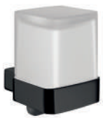
01 Flüssigseifenspender mit Stülpbeker Kristallglas satiniert, Wandmodell Liquid soap dispenser with satin crystal cup, wall mounted