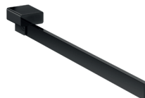
Handtuchhalter 1-armig, starr, 310/410 mm