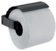
01 Papierhalter mit Deckel