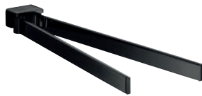
02 Handtuchhalter 2-armig, schwenkbar, 310/410 mm Towel holder 2-arms, swiveling, 310/410 mm