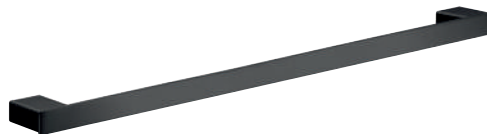
Badetuchhalter 642 / 842 mm