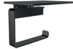
Papierhalter mit Ablage Wandmodell