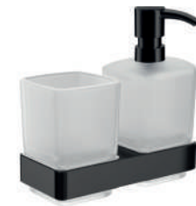
Glashalter/Flüssigseifenspender Kristallglas satiniert, Wandmodell

Glass holder/Liquid satin crystal, wall mounted